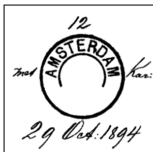
Type II (dikkere buitenrand)