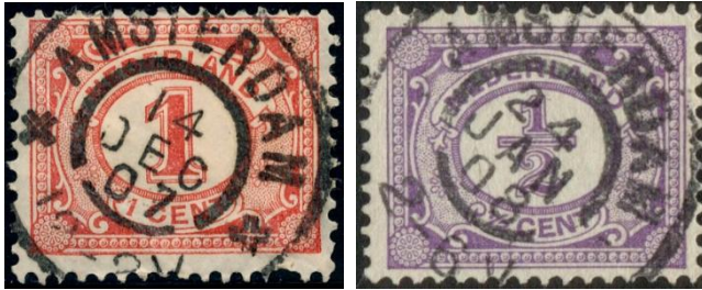
Amsterdam 12-2V (vertrek) Amsterdam 2-6V (vertrek)

Nachtuur karakters werden gebruikt in de grootrondstempels van postkantoren die correspondentie meegaven aan of ontvingen van de nachttreinen op het traject Amsterdam-Rotterdam-Dordrecht v.v.