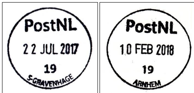
Type I met schreef

PostNL gecentreerd: woordbreedte PostNL 22 mm