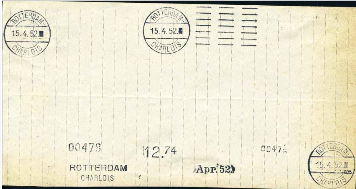
Afgebeeld is een proefafdruk van de postwisselstempelmachine van het bijpostkantoor Rotterdam-Charlois uit 1952.

Rechts van de twee stempelkoppen is een numeroteur gemonteerd dat met elke slag met een cijfer verspringt. De numeroteur draait tegelijkertijd mee met de stempelkoppen.